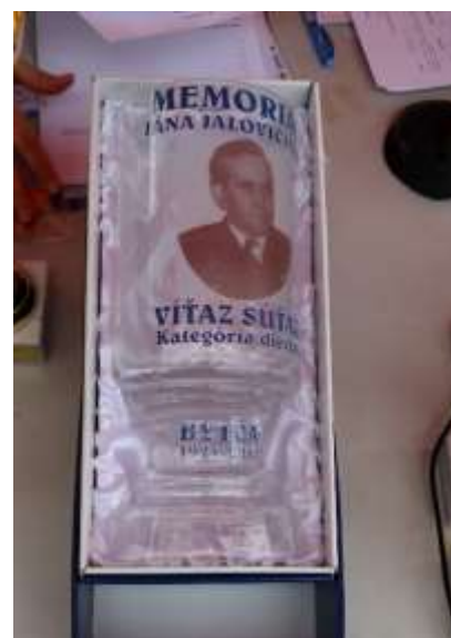
Spracoval PhDr. Martin Gácik

Zdroj: https://www.facebook.com/search/top/?q=zš%20bytča